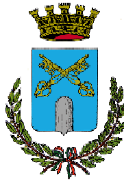
Comune di Montegrotto Terme