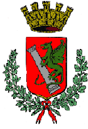
Comune di Abano Terme