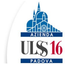
Distretto Socio-Sanitario n. 5